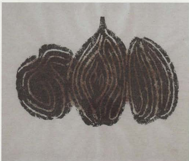
▲ EMPREINTE D'ARDOISE GRAVÉE COLL. PRIVÉE, BRUXELLES PHOTO : C. LOUERGLI © SABAM BELGIUM