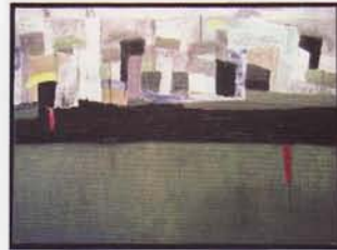
Piniang, Libre Choix ©

28/01-13/02 : Dakar banlieue, peintures de Piniang