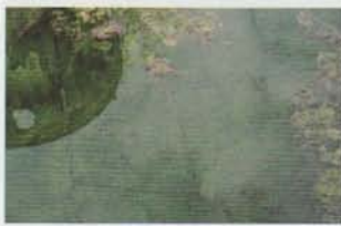
Gilles Préart, Traits sous eau n°2, G. E. Brugmann ©

>10/02 : Reflexions and Thoughts, Gilles Préart