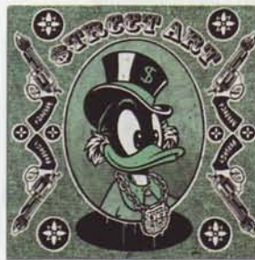
Speedy Graphito, Libre Cours ©

Une exposition collective qui réunit quatre artistes de la scène contemporaine, français et américains, issus de courants artistiques divers tels que le street art, la figuration libre et narrative, ainsi que la sculpture.