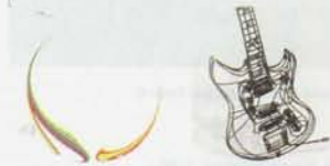
Urfels & Raschke, G. Dubois Friedland ©

Deux artistes pour une même obsession : le « point » de vue. Pour Patricia Urfels Kronenwerth un minimalisme radical qui l'amène au point central, au point focus, à l'illustration de la « fovéa », point aveugle, sans cesse réillustré. Pour Thomas Raschke, cette ambivalence de la ligne qui trace et fige et dont il se libère en la créant en volume, tel un « wire frame » informatique intégralement réinterprété en sculpture de fils d'acier, multipliant ainsi les « points » de vue possibles.