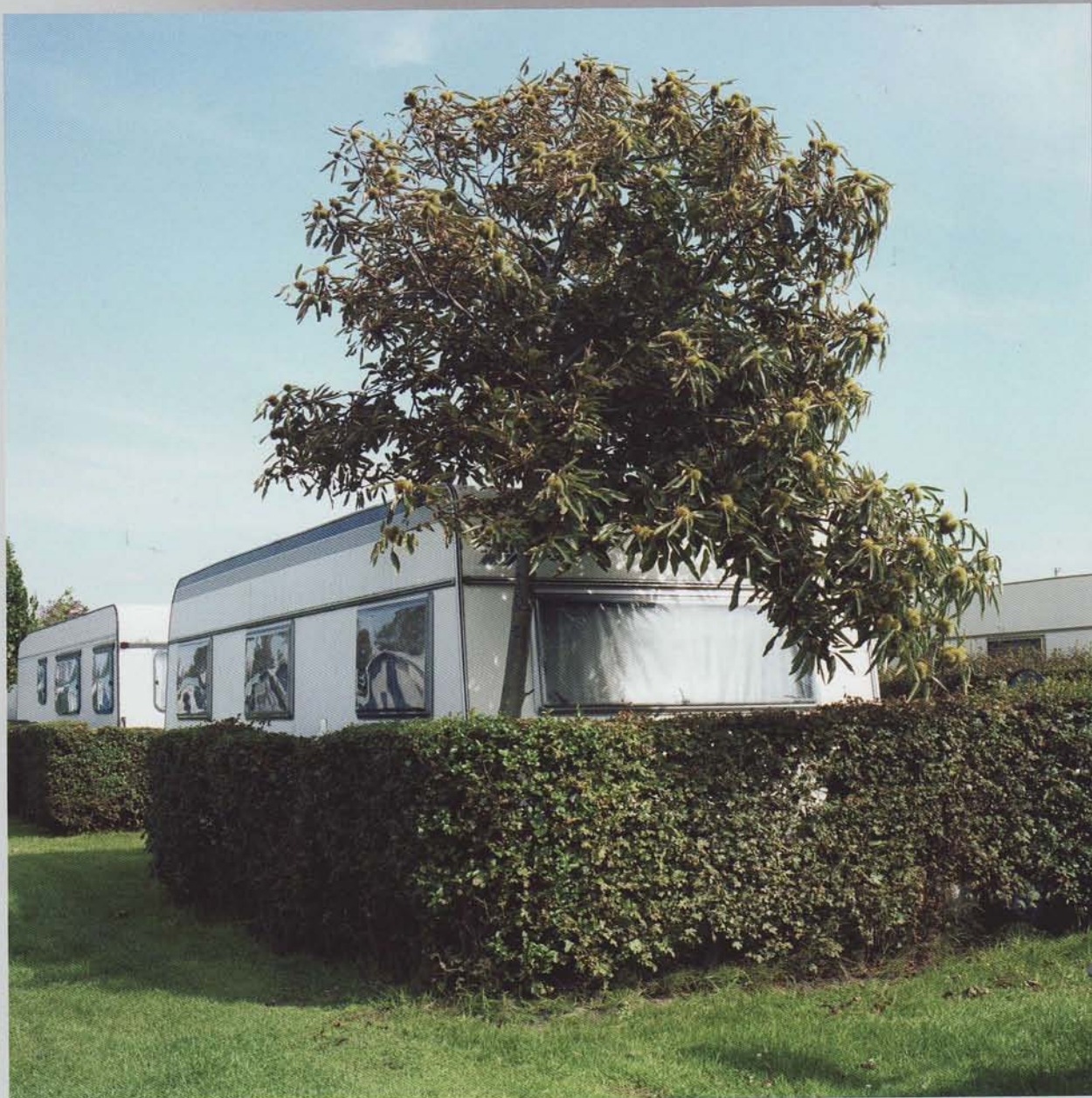
Série « Vivons Cachés », Katherine Longly, 2010

La vie dans un camping peut parfois être ambiguë.