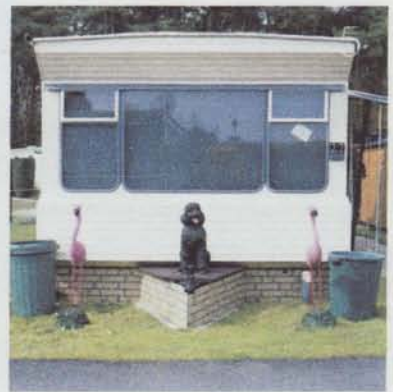
1. Vivons cachés 05.