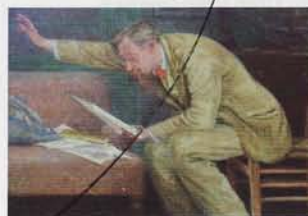
Constant Montald, collection privée