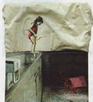
Sonia Aniceto, Libre Cours ©

Sonia Aniceto assemble fils, tissus, textures, dessins et coups de pinceau, à la manière de