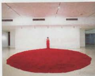
Nelly Agassi, Keitelman ©

5/04-23/04 : 30 ans d'activités 30/04-30/06 : La nuit la plus longue - Nelly Agassi