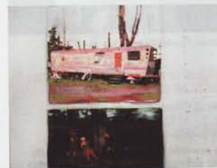
Pablo Avedaño, Libre Cours ©

>30/04 : Plot series - Pablo Avedaño 2/06-9/07 : Dream child - Ronald Ceuppens