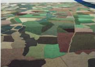
Gal Weinstein, Keitelman Gallery ©

Gal Weinstein trouve son inspiration dans des images iconiques gravées dans la mémoire