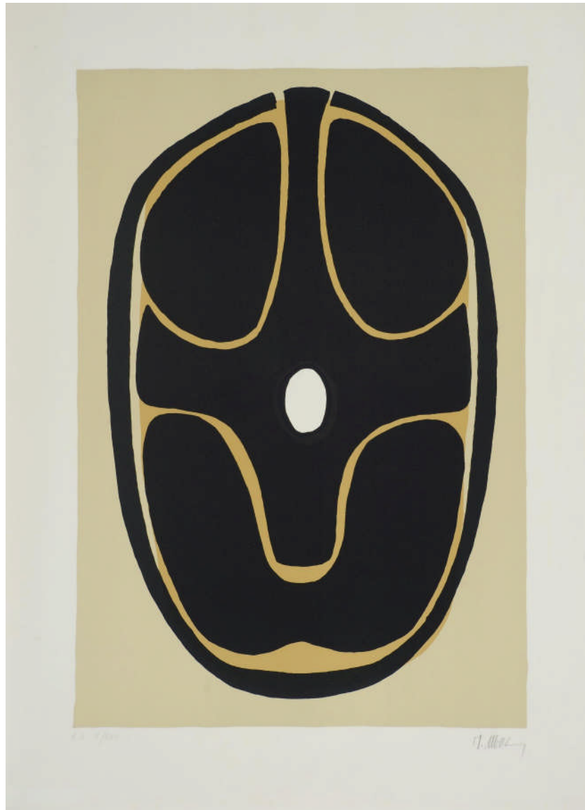
Photo Luc Schrobiltgen - Collection privée, Bruxelles - © SABAM Belgium

Lithographie en couleurs, 1975, tirage à 99 exemplaires + 25 épreuves d'artiste sur Vélin d'Arches