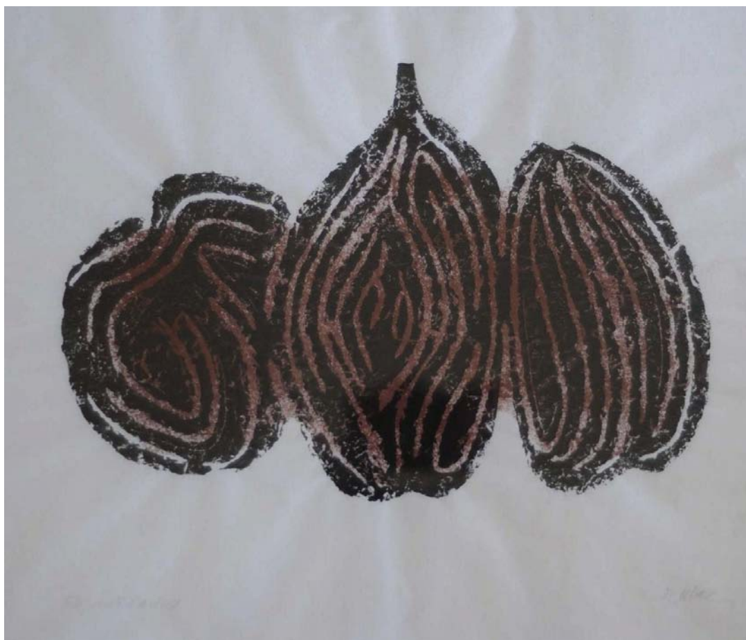
Photo Christophe Louergli - Collection privée, Bruxelles - © SABAM Belgium

« Les fruits », Empreinte d'ardoise gravée en deux couleurs sur papier Japon