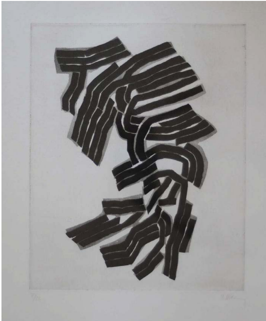
Collection privée, Bruxelles - © SABAM Belgium

Eau-forte et aquatinte, 1970, tirage à 12 exemplaires sur Vélín d'Arches