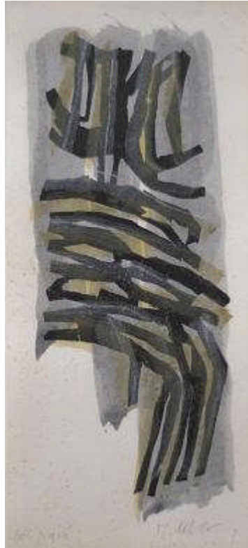
Photo Christophe Louergli Collection privée, Bruxelles © SABAM Belgium

Bois gravé original réalisé par Raoul Ubac en 1965 pour illustrer le livre « Le cinquième château » de Gaston Puel, collection « La fenêtre ardente »