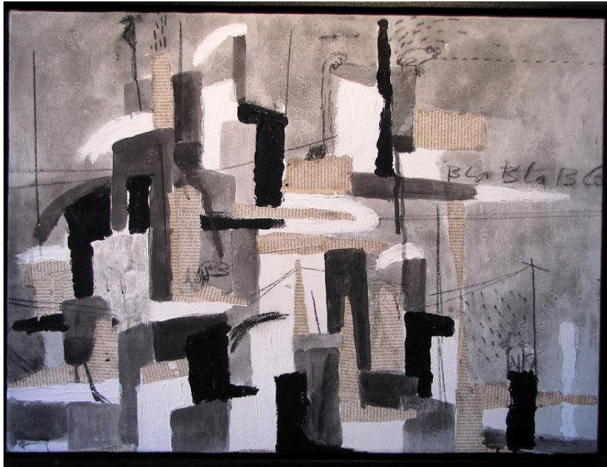
Série « Dakar Banlieue », 2010 H 55 x L 75 cm Acrylique et collages sur toile