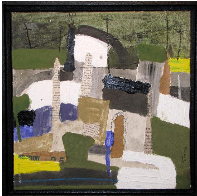
Série « Dakar Banlieue », 2010 H 30 x L 30 cm Acrylique et collages sur toile