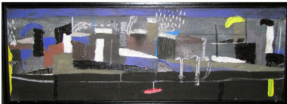
Série « Dakar Banlieue », 2010 H 25 x L 75 cm Acrylique et collages sur toile