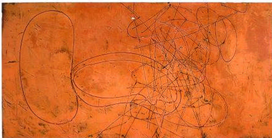
2010 – Sans titre