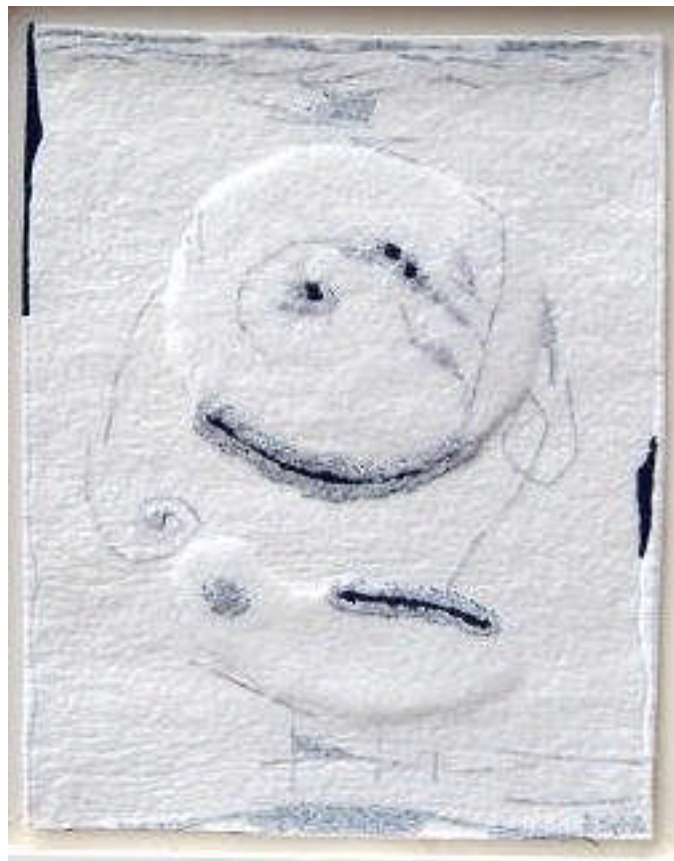
Feutre industriel, fils de lin, fils de coton