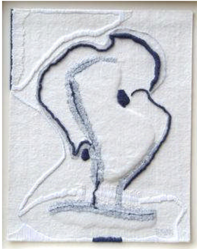
Feutre industriel, fils de lin, fils de coton