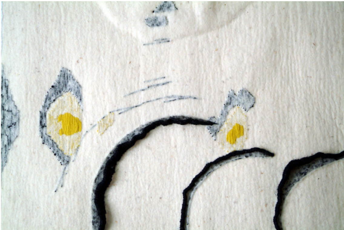
Feutre industriel, fils de lin, fils de coton, pigments