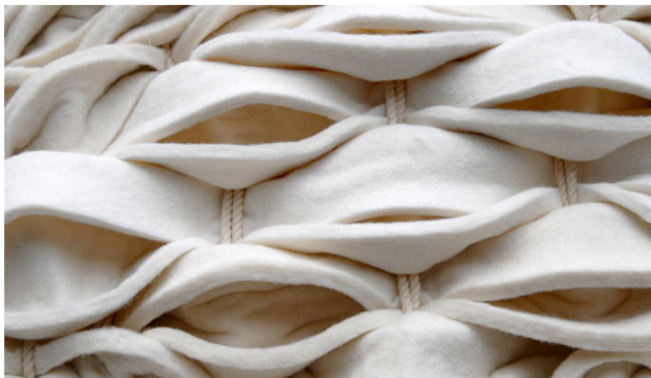
Feutre industriel – Ci-dessus détail de la matière